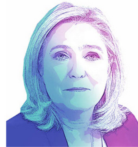
Marine Le Pen